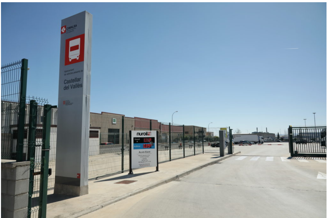
El Truck Castellar amb llum natural