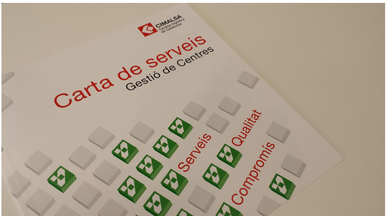
Carta de serveis